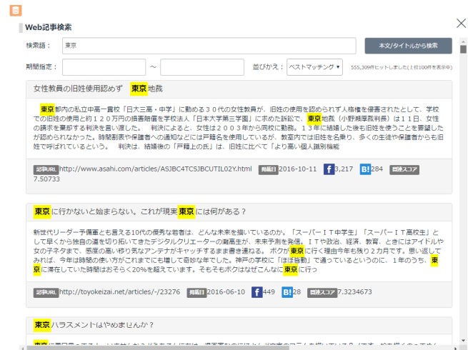
350万件のWeb記事を自由に検索でき 反響が高く関連度の高い順に表示される